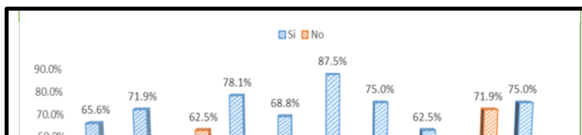
Figura 2. Sistema de Control Interno de la Municipalidad Distrital de los Olivos, 2018

En la tabla 2 y figura 1: se observa que, El 65.6% de los entrevistados manifiestan que, si consideraría implementar un Sistema de Control Interno en la municipalidad distrital de los Olivos, 2018, asimismo, el 71.9% revelan que, el control interno sería una buena herramienta, por otro lado, el 87.5% Está de acuerdo en implementar el Control Interno en todas las Oficinas de la Institución; pero el 71.9% indica que, no se cuenta con el capital humano y logístico para poder implementar el Control Previo. También, el 62.5% de los encuestados, indican que en la actualidad no existe alguna herramienta para controlar los documentos, por otro lado, el 75% Considera que tendría relevancia el colocar el Control Interno en la Institución.